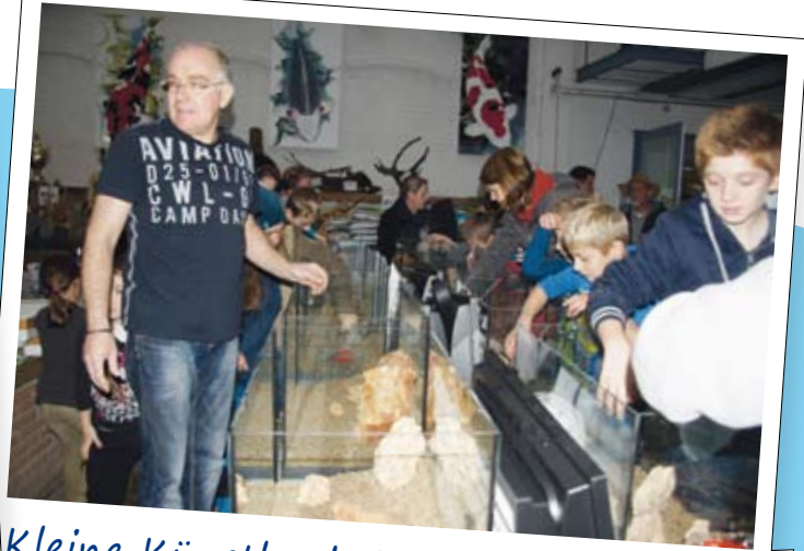
Kleine Künstler beim Kids-Workshop