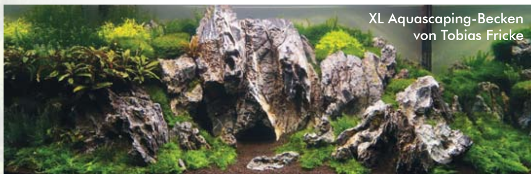
XL Aquascaping-Becken von Tobias Fricke