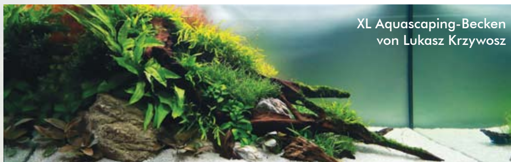
XL Aquascaping-Becken von Lukasz Krzywosz

PS. Ich möchte Euch noch mal darauf hinweisen, dass Ihr bei Aufnahme in unsere Kundendatei das Magazin jedes Mal kostenlos per Post zugeschickt bekommt.