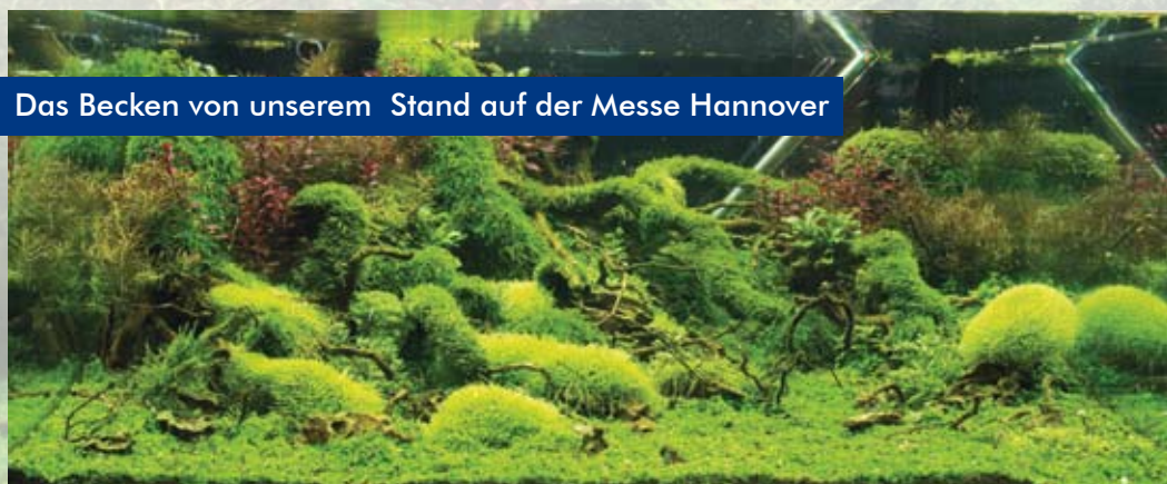
Das Becken von unserem Stand auf der Messe Hannover