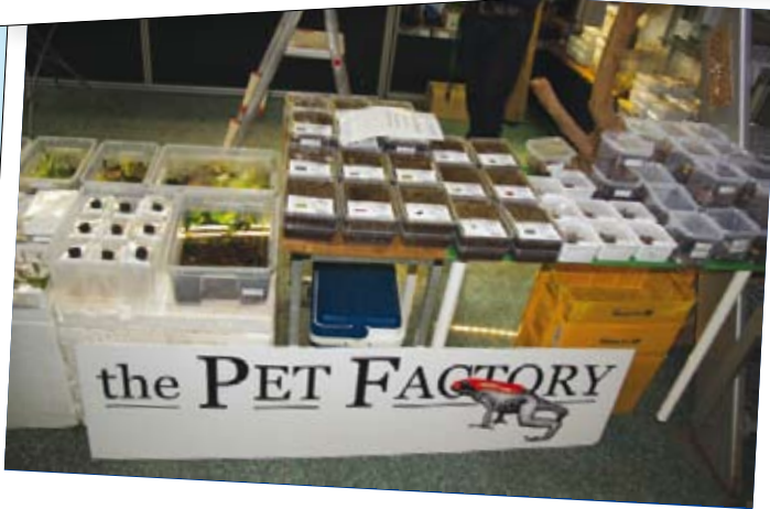
Terraristik hautnah erleben!