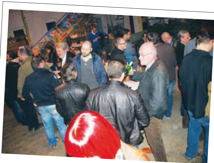
Party am Abend!