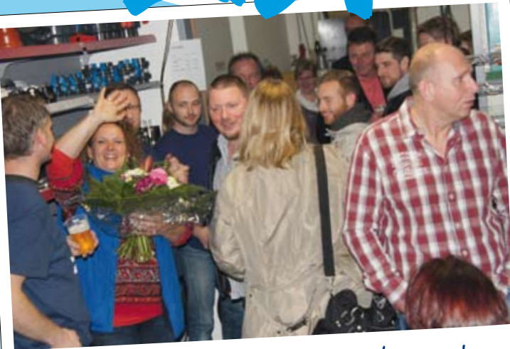
Viele Gäste und schöne Blumen!